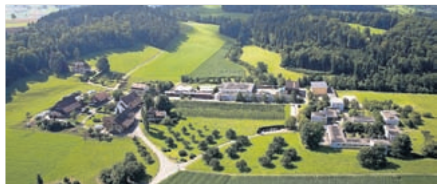
BALD GEFÄNGNISSTANDORT? Der Arxhof oberhalb von Niederdorf.

Zu lösen gilt es nun die finanzielle Frage. Das Projekt darf das Investitionsprogramm des Kantons nicht belasten. «Wir müssen also nach kreativen Lösungen suchen», meint Rossi. Denkbar sei etwa eine andere Rechtsform; das Ju-